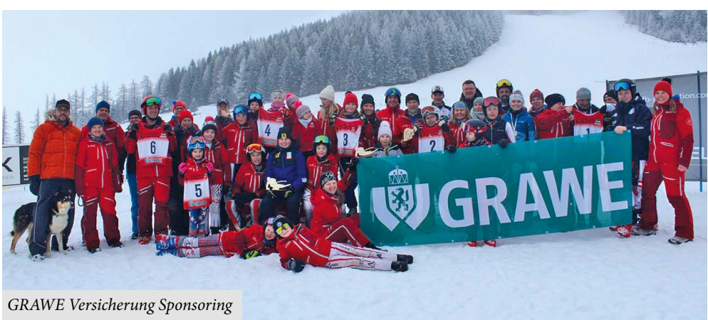
GRAWE Versicherung Sponsoring