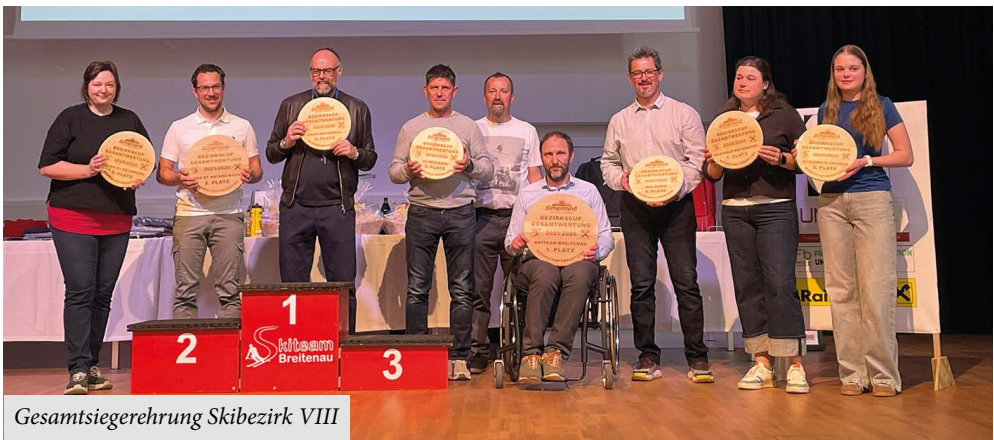
Gesamtsiegerehrung Skibe-zirk VIII

Ein großes Danke geht diese Saison an die GRAWE Versicherung, welche uns neue Startnummern zur Verfügung gestellt hat. Vielen Dank Thomas Reinhardt für deinen Einsatz! Ebenso ein großes Danke an unsere vielen fleißigen Helfer und Trainer, welche ihre Freizeit für uns und unsere Kinder investieren!